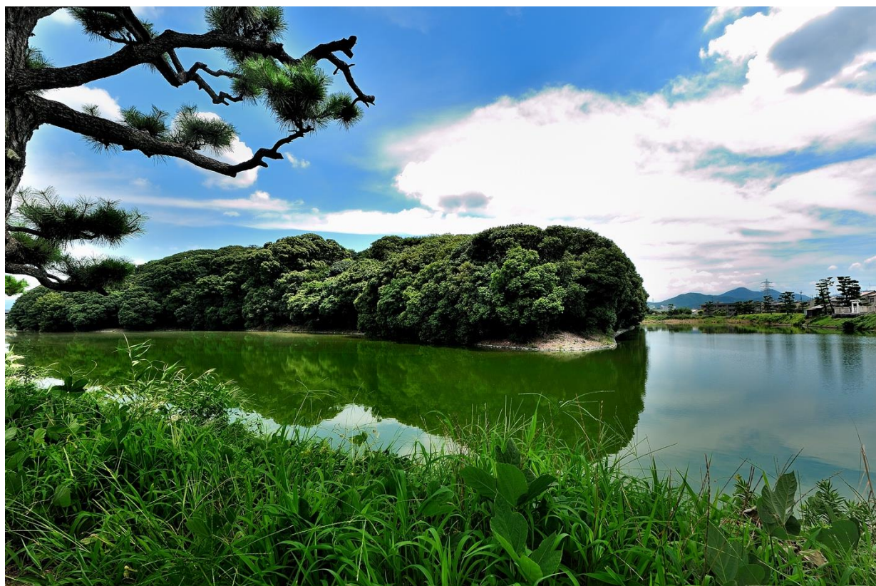
周濠にはたくさんの水鳥が飛来する仲哀天皇陵古墳

産婦人科オンライン ( https://obstetrics.jp/ )、小児科オンライン ( https://syounika.jp/ ) は、産婦人科医、小児科医、助産師にスマホから相談できるサービスです。平日 18 時～22 時の間、10 分間の予約制で相談できる「夜間相談」と、毎日 24 時間メッセージを送れる一問一答形式のサービス「いつでも相談」の 2 つの形式で相談に対応しています。「子どもの湿疹のケアについて」「月経前のイライラがひどい。対処法は？」「夜から発熱。受診すべき？」など何でも気軽に専門家へご相談いただくことが可能です。