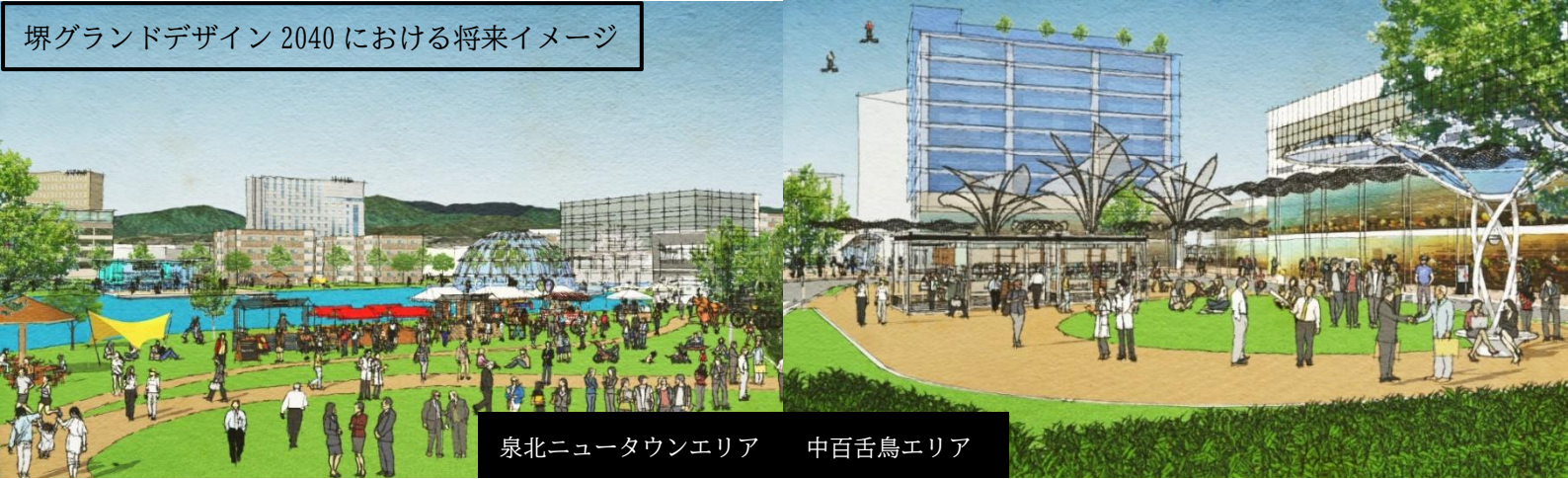
泉北ニュータウンエリア 中百舌鳥エリア